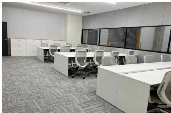
▲モデルルーム内会議室

当社敷地は東京都心・羽田空港に近接、首都高速羽田線「平和島」出入口まで約1km・湾岸線「大井南」出入口まで約3km、JR「浜松町」駅から東京モノレールで10分。物流拠点として最適かつ希少な立地のため雇用優位性が高く、その優位性をご体感いただけます。また当社物流施設は、オフィス・ショールーム・ラボ・メンテナンスセンターなど、多様な用途でご利用いただいております。事例のご紹介とともに、それら造作を可能とする物流ビルA棟ならではの特長をご説明いたします。